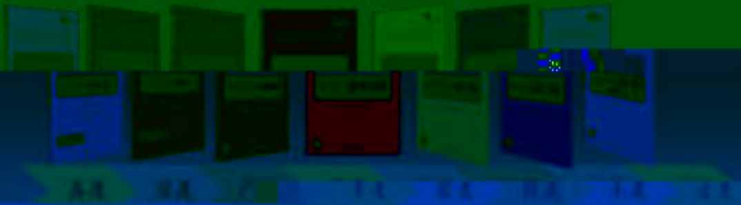
一体化课程教学设计 综合实训基地